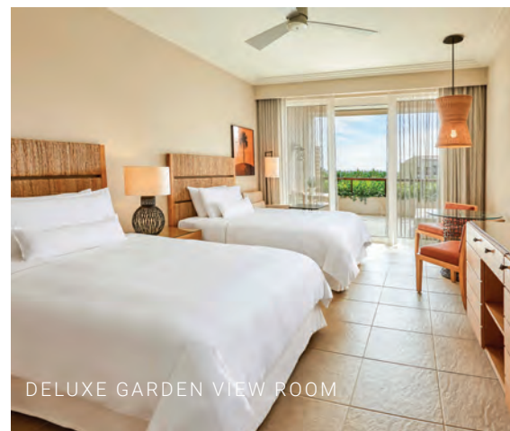
DELUXE GARDEN VIEW ROOM

Derzeit (Stand 01.12.2024) sind für die Einreise nach Griechenland aus der EU und aus der Schweiz keine Impfungen vorgeschrieben.